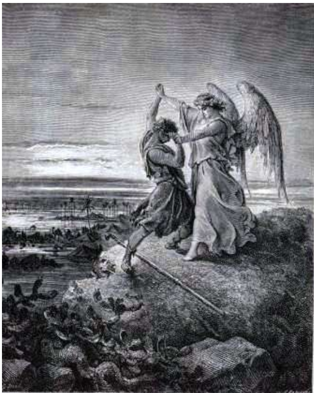
Fig. 3 La lotta di Giacobbe con (per) l’angelo Questo enigmatico episodio del Genesi (Gn. 32, 23-32) è risolto nell’ottica dell’architettura spirituale dello sci’ismo di cui Corbin si fa inter-

Un brano che ricorda molto la condizione degli uomini in stato di contenzione presenti nella caverna platonica e fissamente costretti a guardare verso la parete “televisiva” (premonizione straordinaria!), cui succede infine il risveglio dalla condizione passiva e l’uscita dall’antro. Ciò costituisce il passare dall’ombra delle cose alla luce che le genera, dalle forme formate e ingannatrici alle forme formanti.