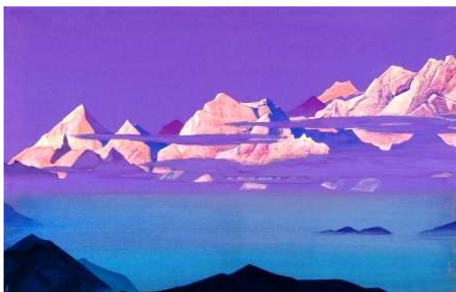
Fig. 8 (Himalayas)

me annuncio e anticipazione della restituzione della Terra al suo stato pristino, una volta allontanate e sconfitte le contropotenze oscure. Ciò avviene parallelamente per la Donna vestita di Sole descritta nell'Apocalisse in lotta con il Drago emblema della Sophia. (sul tema si veda H. Corbin: La Sophia eterna)