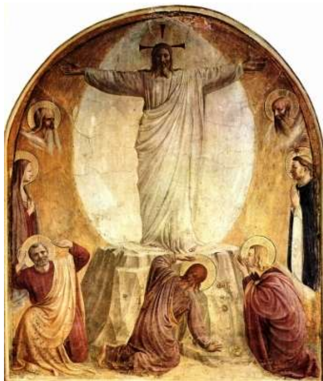
Fig. 2 - Trasfigurazione di Cristo sul Monte Tabor del Beato Angelico

regale Sofia, vera chiave di lettura dell'universo immaginale, conosciuta a diverse latitudini con varie denominazioni, a seconda del contesto di riferimento. L'accenno alle icone ci offre l'occasione per indicare, evidentemente solo in maniera stringata, un'altra caratteristica dell'universo intermedio, scaturente dalla luminosità aurea di cui si diceva.