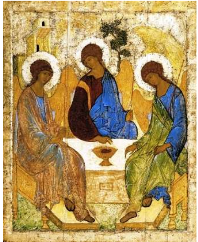
Fig. 5 La filossenia di Abramo (la Trinità)

L’unità personale è infatti pleromantica. Questo è il punto su cui Corbin torna sempre con insistenza e, necessariamente, noi con lui, diversamente v’è perenne mutilazione e alla mutilazione s’accompagna l’angoscia della separazione che nessun intervento terapeutico d’ordine psicologico sarà in grado di sanare. Infatti, per esprimerci nei termini della medicina asclepica, solo attraverso l’“ignizione del sale”, cioè bruciando le scorie titaniche che inquinano l’anima, (sottraendo la luce dalla presa dell’ombra), si potrà conseguire la “salute” (che è naturalmente il ripristino della gerarchia che dalle forme interiori conduce fino al ristabilimento di quelle esteriori).