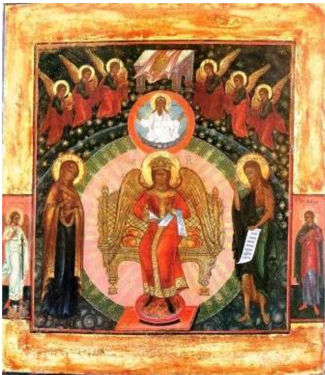
Fig. 7 - Icona di Novgorod

Qui, appunto, tradizionalmente l'Iran mazdeo colloca Spenta Armaiti, l'arcangelo femminile della Terra che è Terra di Luce. Esso riappare in altra forma di medesima sostanza nell'Iran sciita come Fatima-Sofia, Anima della creazione (l'Anima del Mondo platonica).