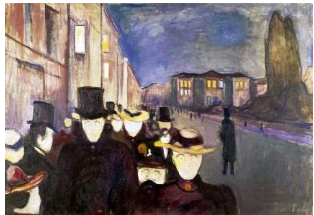
Fig. 6 Le forme del mondo immaginale riflettono lo stato dell'anima individuale sono il suo "angelo" e quindi, oltre a figure di pura luce, ve ne sono altre d'aspetto tenebroso, orride e ripugnanti a vedersi. Sono queste le immagini che tormentano

Non sempre però l'angelo della persona assume forme sfolgoranti di luce a formare quella che i testi definiscono Natura perfetta . Proprio perché controparte della persona riflette le azioni di colui con cui è associato, proprio perché è figura della sua anima, come dianzi affermato. Quando l'anima è empia genera le forme tenebrose che costituiscono il tormento dei reprobì, in vita (nei sogni e negli stati visionari) e nel post-mortem. Queste forme orride e ripugnanti che si svincolano da ogni controllo richiamano in qualche modo uno dei "doppi" più noti in letteratura, si parla dell'opera letteraria Il Ritratto di Dorian Gray in cui la rappresentazione del protagonista sulla tela del quadro ne raffigurerebbe il "doppio immaginale", l'effigie di un vizioso in stato di perenne deterioramento animico.