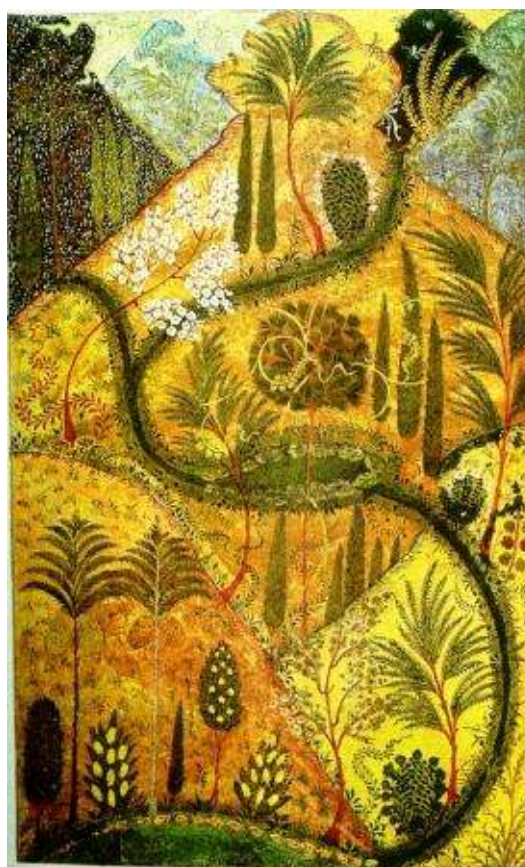
Fig. 4 Paesaggio di Xvarnah

“Tali che faranno un mondo nuovo, sottratto alla vecchiaia e alla morte, alla decomposizione e alla corruzione, eternamente vivo, eternamente crescente, potente secondo la sua volontà, allorquando i morti si risolleveranno, l’immortalità verrà ai viventi, e il mondo si rinnoverà a meraviglia” (Yash XIX, 11 e sgg.)