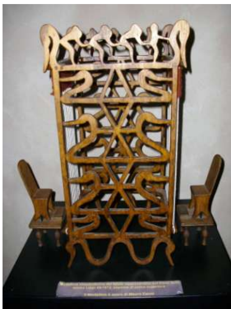
Fig. 4 - Lo straordinario telaio con il quale si tessavano esclusivamente i paramenti destinati al lungo e complesso rituale funerario ( Museo di Verucchio)

dalla pesanteur corporale, si poneva in viaggio verso la rotta nordica dell'ambra e del cigno (il significativo titolo di un altro testo dedicato alla Verucchio è: Il dono delle Eliadi, Ambre e oreficerie dei principi etruschi di Verucchio )