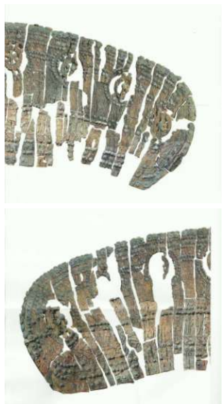
Fig. 2 - Lo schienale del trono ligneo di Verucchio, così come si presenta oggi. Lo stato di conservazione è eccezionale

La tomba principesca contiene i resti ossei di un personaggio di alto lignaggio conservati in un cinerario bronzeo “vestito”.