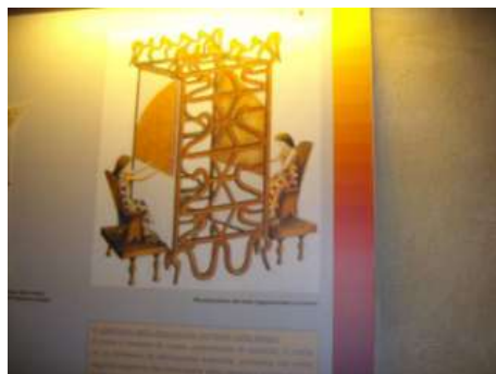
Fig. 5 - La ricostruzione della posizione e dell'abbigliamento delle tessitrici (Museo di Verucchio)

La via dell'ambra era propria della località in cui è ubicata questa necropoli. Verucchio era il centro fulcrante nell'Adriatico per il commercio dell'ambra, nel mito (fra gli altri) il prodotto delle lacrime delle Eliadi (le sorelle di Fetonte) come ci ricordano i versi della tragedia euripidea, l'Ippolito: