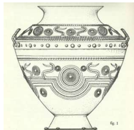
Fig. 1 - Vaso bronzeo rinvenuto nella necropoli dei Quattro Fontanili a Veio. Si tratta di un’elegantissima rappresentazione sintetica della barca solare con le due protomi di cigno che, nella loro contrapposizione, mostrerebbero il movimento periodico delle migrazioni di questi volatili che conducono Apollo agli Iperborei.

ce, è affiancato da cigni, che lo trainano lungo nel suo viaggio sul fiume Oceano.