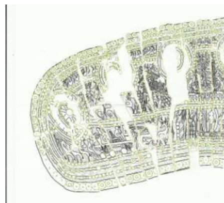
Fig. 3 - Estrapolazioni della complessa partitura narrativa del "racconto funerario" costituente il reperto

Il reperto in sé è "vivo per miracolo" trattandosi di materiale organico ligneo particolarmente soggetto al deperimento. Esso invece si è con-