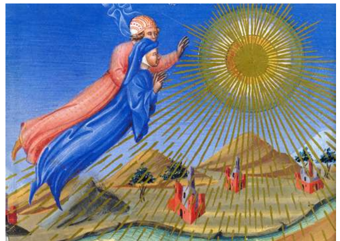
Fig.1 - Miniatura dell'ingresso di Beatrice e Dante nel cielo del Sole

ti gli opportuni distinguo nei confronti del minestrone parareligioso dilagante, una migliore riflessione sul significato dei termini potrebbe forse portare ad una felice coabitazione tra exoterismo ed esoterismo, essendo uno il corollario e la radice dell'altro.