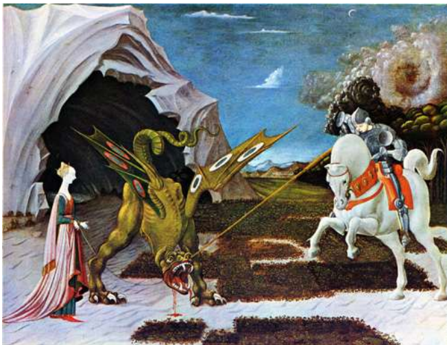
Fig.2 - Paolo Uccello. San Giorgio il drago e la dama

a, l'astrologia, la matematica, la cabala e, in genere, parla per "parabole"; così come probabilmente faceva Cristo quando intendeva preservare la parte più profonda dei suoi insegnamenti da coloro che non erano in grado d'intenderla. Ed agli Apostoli, parlava invece "direttamente".