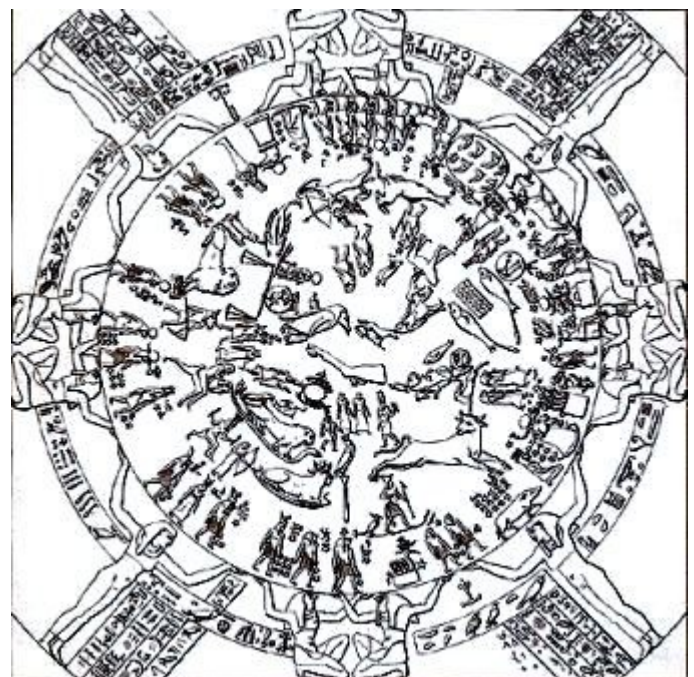
Fig. 1 – Lo zodiaco del soffitto del tempio di Hathor a Dendera (epoca tolemaica).

Alla fine dei dodici mesi erano aggiunti cinque giorni (giorni epagomeni) per mantenere il più possibile in linea il calendario lunisolare con il tempo del reale movimento solare: si ebbe così un anno di 365 giorni contro i 365,25 del ciclo solare.