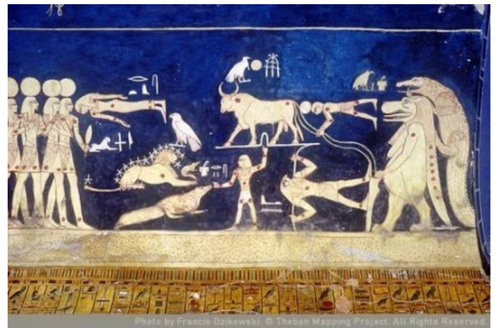
Fig. 3 – Particolare: le Stelle Imperiture, cioè le stelle che non tramontano mai, che gli Egizi ritenevano fossero la sede dei Faraoni dopo la morte.

Nel tempio di Dendera a questi riti si aggiungevano nei giorni tra la semina e la germinazione una serie di rituali specifici per “ritrovare” i pezzi in cui il Dio era stato smembrato da Seth secondo una delle versioni del mito 15 .