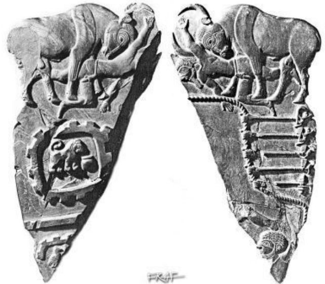
Fig. 5 – La “paletta del toro”: l’immagine del toro che sconfigge i nemici dell’Egitto raffigura la potenza del Faraone (età predinastica).

gonico e quindi creatore dell’Ordine quale Khnum.