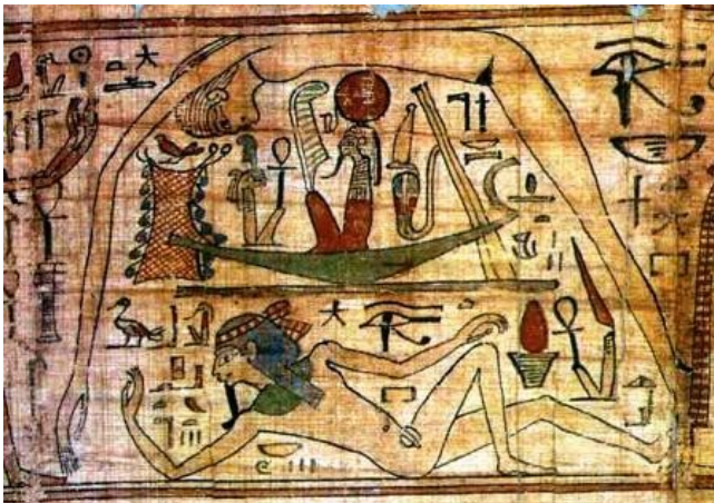
Fig. 7 – La divisione di Geb da Nut: in una delle versioni del mito l'opera è condotta da Râ con l'assistenza di Maat, divinità dell'Ordine cosmico.

Alla base del rituale vi era l'offerta ad Osiride e ai defunti (come nel nostro Due Novembre) di ghirlande di fiori simboleggianti il rinnovarsi della vita, accompagnata da musica e danze: le barche sacre partivano dal tempio di Karnak ed attraversavano il Nilo per recarsi ai templi funerari dei Faraoni costruiti sulla riva occidentale, considerati membri della famiglia divina in quanto figli degli Dèi, mentre i privati si riunivano presso le tombe dei loro avi festeggiando allegramente con canti e bevute.