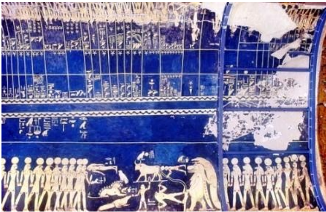
Fig. 2 – Immagini delle costellazioni (tomba di Sethi I).

In un certo senso questa festa è analoga alla Bella Festa della Valle della quale parleremo più avanti, in quanto essa, celebrata il I mese di Akhet (Tekh) nei giorni 17 e 18 7 , consisteva in una cerimonia che si svolgeva ad Abido in onore di Osiride e dei defunti, identificati con lui. È tra le feste più antiche, in quanto essa compare già in iscrizioni del Regno Antico.