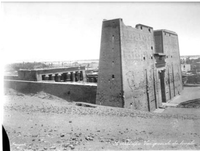
Fig. 8 – Il tempio di Horo a Edfu in una foto del 1865.

e nei giorni successivi di Luna crescente si svolgeva la seconda parte della Festa, cioè la Festa di Behdet, della durata di due settimane, quindi Hathor ripartiva per Dendera nel giorno di Luna Piena, gravida del figlio di Horo.