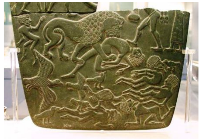
Fig. 4 – La “paletta della battaglia”: il faraone è rappresentato sotto forma di leone che sbrana i nemici (età predinastica).

La scelta del salice è legata alla sua capacità di germogliare in breve tempo da un ramo tagliato: simbolo quindi di rinascita e per questo connesso al mito osiriaco di morte e resurrezione.