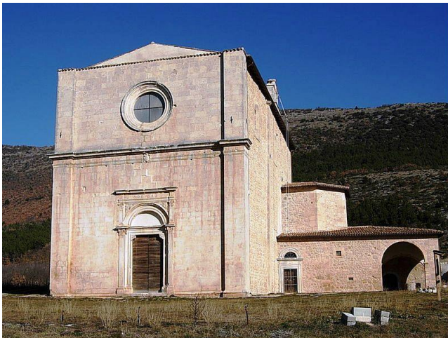
Fig. 4 - S. Maria di Cintorelli (o Centurelle)

L'incontro-scontro tra pastori e contadini fu altro aspetto della civiltà della transumanza. Nella sua essenza essa infatti si fondava sulla collaborazione ed integrazione economica di agricoltura ed allevamento con continui scambi e collaborazione. Storicamente però, e in modo significativo dal medioevo in poi, gli agricoltori hanno sempre tentato di erodere i tratturi, per appropriarsi dei terreni resi fertili grazie al concime ovino. Per questo motivo i sovrani del Regno di Napoli sono stati costretti a continue reintegre, cioè restituzioni de iure e de facto di strisce di terreno dei tratturi, sottratte dai contadini ai pastori, che ne avevano necessità nei periodi dell'anno più intensamente percorsi.