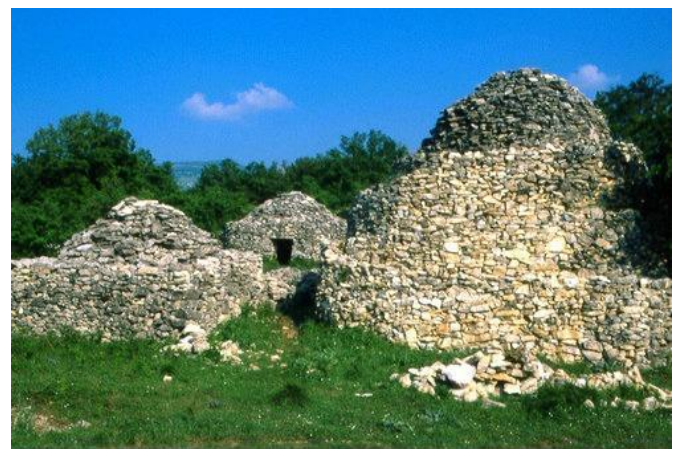
Fig.5 - Case di pietra a secco

Un esempio su tutti può essere fatto col Tratturo Magno, che collegava L'Aquila a Foggia, per una lunghezza di km 243; attualmente le due città distano tra loro per strada circa 300 km (con o senza tratti autostradali, oltre il 20% in più) e per ferrovia km 324 (oltre il 30% in più)!