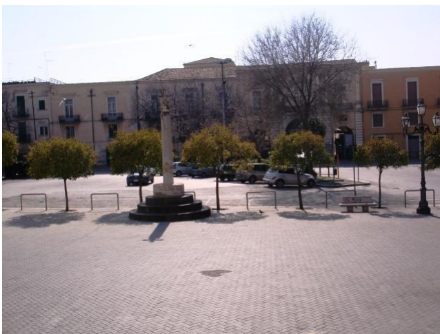
Fig.8 – Piazza S. Giovanni (dove si vede Porta Arpi)

gnamente concluso. Non a caso il viaggio iniziava da S. Maria di Collemaggio di L'Aquila e terminava al Piano della Croce di Foggia, dove c'è la chiesa di S. Giovanni Battista, il santo che battezzando Gesù conferisce l'unzione particolare atta a realizzare il supremo sacrificio. I pastori giunti in Tavoliere erano ancora sporchi di sudore e di scorie interiori. Era quindi necessario lavarsi in una pozza, che oggi è stata coperta, per accedere al tempio.