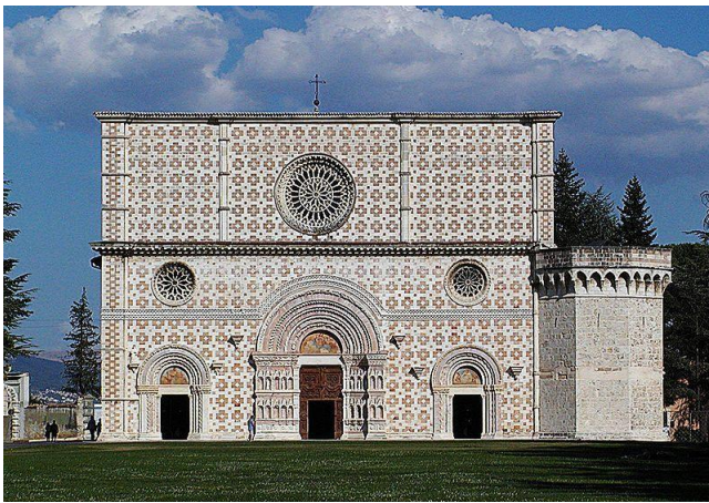
Fig. 2 – S. Maria di Collemaggio

Un fatto che non va sottovalutato è il culto della Dea Madre, le cui tracce sono presenti ovunque. La transumanza, se non ci ha lasciato documenti scritti, è stata però abbastanza generosa in cippi litici, residui vari in grotte, semplici manufatti costituiti da abbeveratoi, edifici religiosi e modeste costruzioni in pietra a secco.