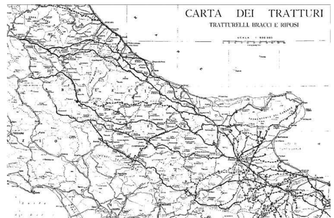
Fig.1 – Mappa dei Tratturi

scutibilmente pelasgica, non avendo nulla in comune con le consuetudini indoeuropee e quindi dei popoli italici. Per praticarla è infatti indispensabile attraversare territori pacifici e non abitati da popolazioni guerriere o tra loro belligeranti. A differenza dell'agricoltura, su cui fin dall'antichità prisca ci sono giunti manuali e trattati specifici, su questo particolare allevamento non ci è pervenuto alcunchè forse perchè ad esso è fortissimamente connessa una tradizione orale, fino agli inizi del '900 particolarmente ricca. Ovunque sia stata diffusa ha avuto caratteristiche fortemente unitarie. La sua localizzazione non fu solo nell'Italia centro-meridionale ma in tutto il bacino del Mediterraneo.