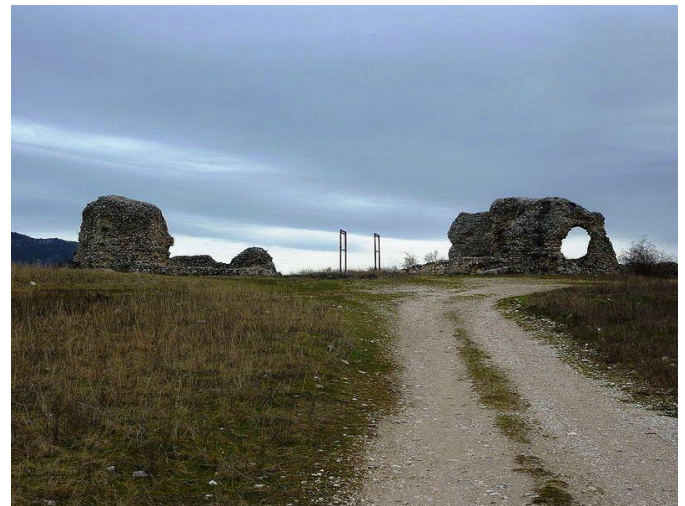
Fig.3 - Tratturo tra le rovine di Peltuinum

tamente. La causa dello scoppio della seconda guerra sannitica fu legata a due episodi che ad essa sono direttamente connessi; la fondazione da parte dei Romani, nel 328 a. C., di Fregellae, vicino l'odierna Ceprano e la richiesta di aiuto dei Dauni ai Romani nel 326 a. C., contro i Sanniti, che esigevano forzata ospitalità ai loro greggi. Da notare che sia la valle del Liri che la Capitanata erano territori indispensabili per lo svernamento ovino, ai quali ovviamente gli italici non potevano rinunciare. Dal III al I sec. i riferimenti diventano più numerosi, fino ad arrivare a Catone (circa 160 a. C.), che nel De agri cultura definì i tratturi antiquissimi e Varone (116 a. C.-27 a. C.), che nel secondo libro del De re rustica (37 a. C.), il De re pecuaria, tratta dell'allevamento ovino fatto dai contadini e la cita espressamente.