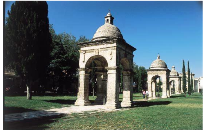
Fig.7 – Chiesa delle Croci

polinea del tratturo era Arpi, centro dauno che risale al neolitico, a poca distanza dalla periferia dell'odierno capoluogo del Tavoliere.