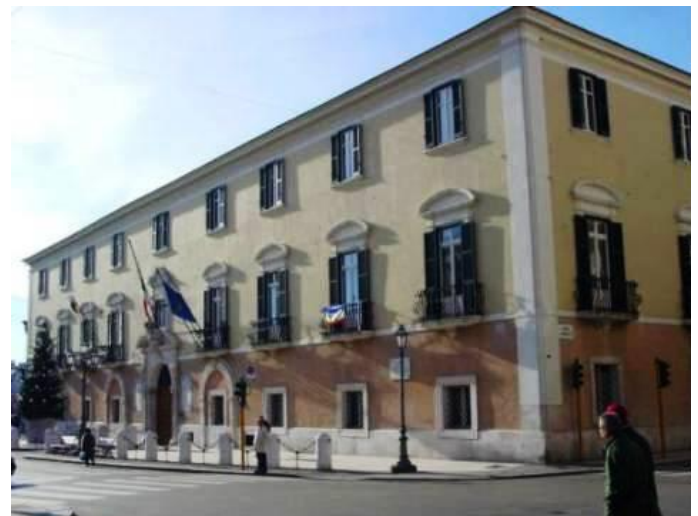
Fig.9 - Palazzo della Dogana

ad Patriam aperuit" (La via del Cielo passa attraverso la Croce. La Croce ha aperto la strada a coloro che sono in cammino verso la Patria [Celeste]). Dopo queste ammonizioni passavano nelle cinque cappelle 14 , sostando in ciascuna e conseguendo stati di alleggerimento e purificazione. All'uomo comune non è concesso l'ingresso in luogo sacro se privo di qualificazione e catarsi. Solo dopo averle percorse tutte è possibile entrare nel templum, la chiesa vera e propria, che oggi è stata restaurata alla moderna ed è priva di significati che prima l'arricchivano e rendevano comprensibile il senso dell'intera opera architettonica. I poveri pastori, stanchi e sporchi esteriormente, qui realizzavano fisicamente un altro tipo di viaggio. Infatti coloro che attraversavano l'arco di ingresso, avendo la luna a sinistra ed il sole a destra, diventavano diversi nell'accedere al fanum, materiale ed interiore, poiché avevano invertito la posizione dei luminari realizzando una particolare con-versione.