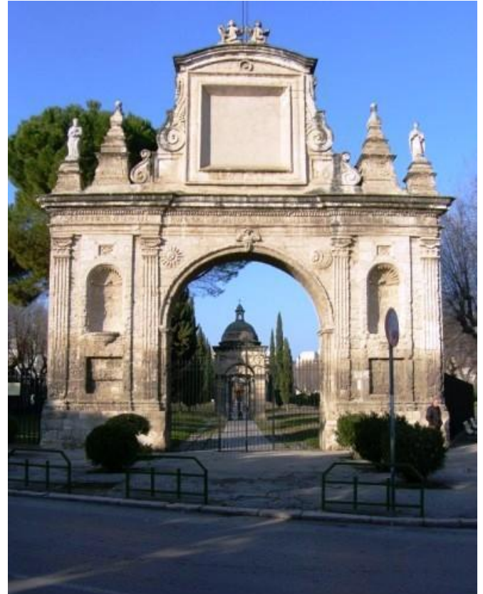
Fig.10 - Portale Chiesa delle Croci

le che forniva previsioni meteorologiche esatte. Questo mondo, gerarchicamente concepito, aveva contatto con i contadini con i quali scambiava formaggio, ricotta e lana per cereali, legumi e sale utilizzato nella lavorazione casearia in pianura 16 .