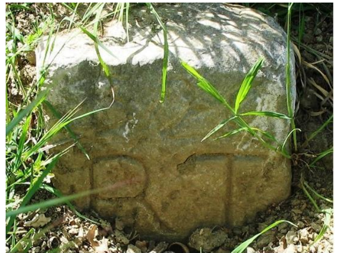
Fig.6 – Cippo RT (Regio Tratturo)

noscere alcuni degli ultimi pastori, che si erano conservati analfabeti allo stato puro, nel senso che non avevano mai frequentato la scuola, non leggevano i giornali, non avevano deformazioni mentali, ma conoscevano perfettamente dettagli sulle guerre sannitiche, la seconda guerra punica e la guerra sociale, molto sentita dagli abruzzesi poiché per la prima volta il toponimo Italia fu usato ufficialmente nella loro regione (la Lega Italica 9 ). Costoro avevano cognizioni di botanica, astronomia, medicina ed arte speciale, musica, abilità manuale nella lavorazione di pietra e metallo che oggi tendono ad essere sottovalutate in ambito accademico se non fosse per una certa curiosità antropologica di maniera.